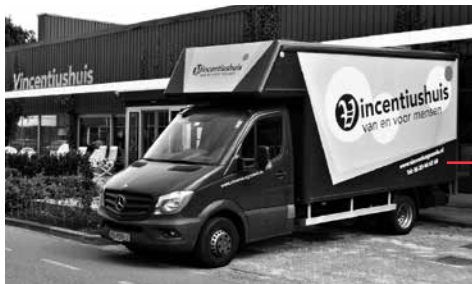
Het Vincentiushuis Groenlo en de gerenoveerde vrachtauto

Het bestuur droomde al jaren van een groter pand met een modernere uitstraling en op een betere locatie, waardoor de omzet in de winkel zou kunnen worden vergroot en verwante organisaties een goede plek zouden kunnen krijgen onder hetzelfde dak. In 2015 werd een eerste plan gemaakt. Men hoopte toen de door de parochie afgestoten Mariakerk te kunnen kopen, maar dat ging uiteindelijk niet door. In 2018 kwam een oude garage aan de Ruurloseweg in beeld. Daarvoor werd een uitgebreid projectplan geschreven en een begroting opgemaakt. Het pand zou twee ton kosten; een vriendenprijs gezien de oppervlakte van 1.150 m 2 plus een ruime parkeerplaats. Er moest wel heel veel aan worden verbouwd. De totale kosten van het project werden op ruim negen ton begroot. Zou dat niet een te grote gok worden? Er waren