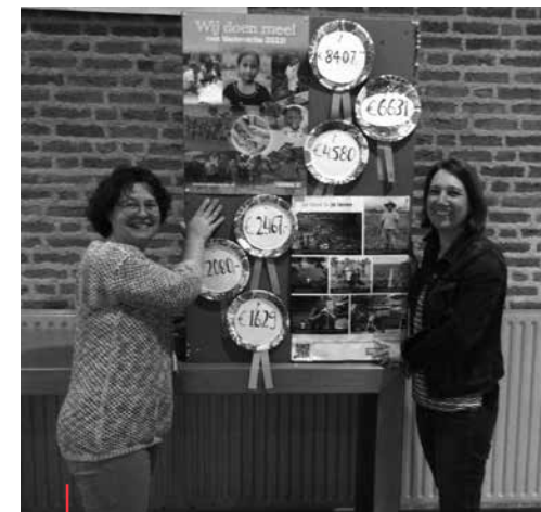
Het eindstandenbord met de bijdragen uit de verschillende dorpen

Net voor de vastentijd in 2022 startte werden