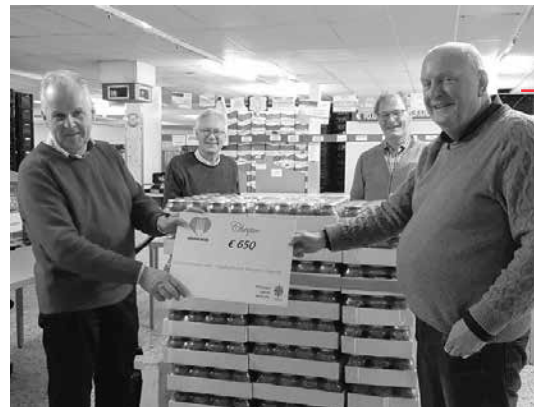
Giften van de Caritas aan de Voedselbank

“Ze krijgen te zien wie je bent en wat je doet”