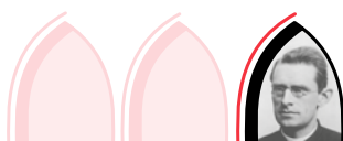
Stichting Het Ariëns-Comité

De activiteiten zijn het houden van bijeenkomsten; het uitgeven van geschriften; het coördineren van activiteiten; en het verzamelen van geschriften en getuigenissen. Het Ariëns-Comité houdt zich aanbevolen voor schriftelijke of mondelinge aanvullingen, onder meer voor de voortgaande onderbouwing ( relatio ) van de zaligverklaring van Alphons Ariëns.