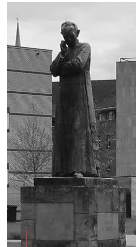
Ariëns monument Enschede 1934