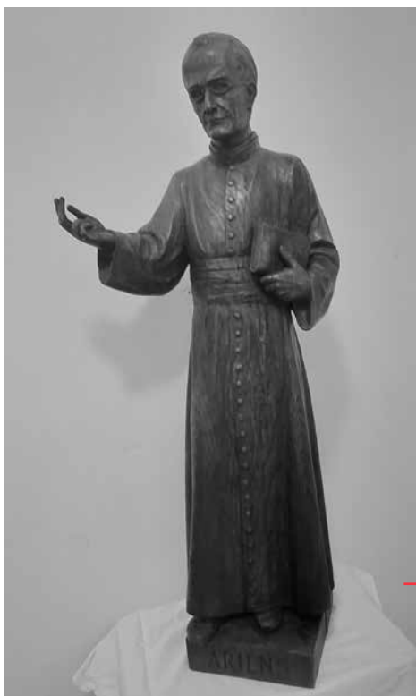
Ariëns beeld 1938

ervaring van Gods verborgen nabijheid. Als je die verborgen nabijheid ervaart helpt je dat in je verkondiging minder een zweverige moralist te zijn; je raakt meer verankerd in het dagelijks leven. De religieuze ervaring is hét medicijn tegen de blikvernuwing van de cultuurpessimist. Deze kun je herkennen aan zijn (bijna nooit haar) klacht hoe slecht 'de wereld' wel niet is omdat ze niet naar de kerk/God luistert. In de mystieke traditie (in onze kerk op een bijzondere manier aanwezig) is er het besef dat er juist in de breuklijnen van het bestaan ruimte komt voor het licht van God dat dóórbreekt. In diaconale projecten (en op heel veel plaatsen daarbuiten) is de gebrokenheid van het bestaan en de kwetsbaarheid en de kracht van mensen dichtbij. Als pastores alleen aanwezig zijn bij breuklijnen in de privé sfeer (ernstige ziekte, overlijden, diepe ervaringen van schuld) kunnen