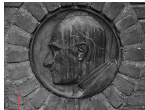
Reliëf Ariëns grafmonument Maarssen

Deze uitspraak van een jurylid tijdens het gesprek over de genomineerde projecten bleef bij iedereen hangen. In de wereld van zorg en welzijn wordt vaak gesproken van 'het product'. Bij diaconale projecten zul je dat niet horen; het zit in het Dna van kerkelijke vrijwilligers en beroepskrachten, dat er primair sprake is van een (korte of wat langere) relatie, waarbij je vertrouwen probeert te winnen en waarbij de hele mens er mag zijn, met zijn of haar talenten en kwetsbaarheden en met zijn of haar geschiedenis en gevoelens, ook die van woede en machteloosheid. In een goed diaconaal project gebeurt er iets aan gever en ontvanger en het is ook een bijdrage aan een menselijker