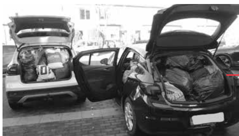
De ingezamelde kleding wordt met eigen vervoer weggebracht