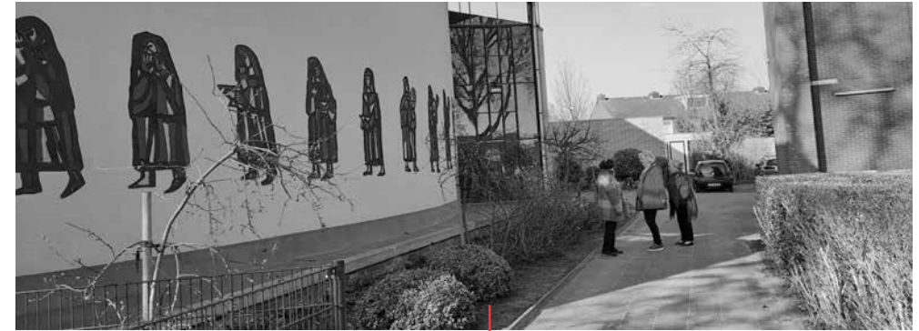
De initiatiefnemers naast de kerk in Baarn

“We delen de overvloed van andere mensen”