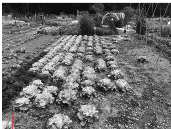
De Groentetuin Lettele ligt er mooi bij