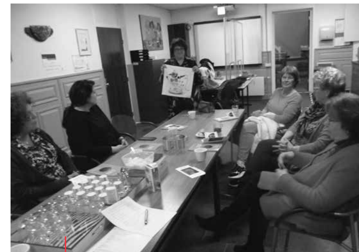
De tienjarige werkgroep bij elkaar met de nieuwe kussenslopen

In Oldenzaal leven veel kinderen met een laag inkomen. Het is een oude arbeidersstad, maar de vrijwilligers twijfelen of het daar door komt. Er leven ook veel mensen afkomstig uit andere landen. Volgens de aanwezige dames is de armoede in Almelo en Enschede groter. Uit eigen ervaring met de feest- en verjaardagsboxen is er elk jaar toch een groot aantal kinderen in armoede. Er zijn altijd voldoende vrijwilligers geweest voor deze activiteit, zowel voor het verzamelen van aanbreng, het inpakken als het bezorgen. De financiële reserves zijn de laatste twee jaar wel gedaald. In de coronatijd was het minder leuk, omdat je als groep niet zo goed bij elkaar kon komen. Toen is het inpakken ook wel eens 's-middags gedaan vanwege de avondklok en thuis. Bezorgers hebben er niet veel last van gehad. De kinderen hebben het niet gemerkt.