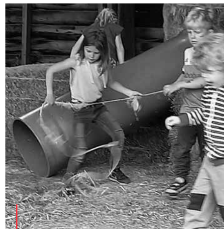
Kinderen bewegen graag in een stimulerende omgeving

"Mensen positief stimuleren, dat is de kunst"