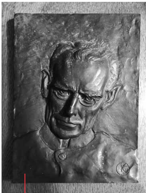
Ariëns koperreliëf 1938