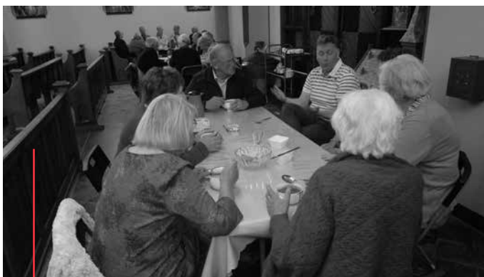
Na de viering is het gezellig bijpraten

Er is een grote behoefte om elkaar te ontmoeten, bij te praten, en gemeenschap te ervaren. Na de tweede keer werd er besloten om het ontmoetingsgedeelte te verlengen met