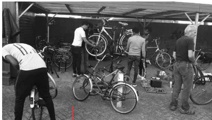
De monteurs zijn druk aan het werk

Er is goed overleg met de bestaande fietswinkel in Dalfsen, want ze willen geen concurrent zijn. De fietswinkel was daar helder in: we worden geen concurrent, want we hebben heel verschillende klanten. De Fietserieje krijgt alle fietsen, alsook onderdelen en gereedschap. Alle fietsen, hoe goed of slecht ook, worden aangenomen. Als er van een fiets nog iets te maken is, wordt hij opgeknapt. Is er niets te repareren, dan worden alle bruikbare onderdelen er afgehaald en wat overblijft wordt verkocht als oud ijzer. De opbrengst is voor kerken in Hongarije. De professionele