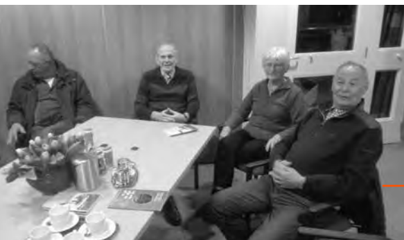
Koffiedrinken, bijpraten en wat eten na het bloed prikken

Tegenover het Kulturhus was vroeger een Buurtsuper gevestigd, die eenzelfde functie had. Die Buurtsuper is verdwenen, samen met veel andere voorzieningen. Er zijn weinig plekken over waar mensen elkaar kunnen ontmoeten. Uit de ontmoetingen op de donderdagochtend ontstaan afspraken om bij elkaar thuis op