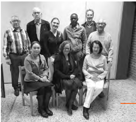
De werkgroep Internationale vieringen

Men sloeg de handen ineen in een werkgroep om hier verandering in te brengen en zo ontstond de eerste internationale viering. Mensen van allerlei nationaliteiten vierden samen het geloof. De volle kerk bewees hoe sterk de behoefte leefde. Iedereen was enthousiast. Alle aanwezigen ervoerden het als een verrijking. Dit gold ook voor de nuchtere Hollanders. Betrokkenheid, een intense geloofsbeleving, sommige gelovigen durfden zelfs het woord ‘Godservaring’ in de mond te nemen, zo sterk voelden zij de ervaring met het goddelijke. Hand in hand het Onze Vader bidden, elkaar oprecht de vrede toewensen, de harten van de aanwezigen werden geraakt en geopend. Er gebeurde iets met hen, men kwam als het ware ‘los’. Mensen voelden en beleefden letterlijk het geloof. Na