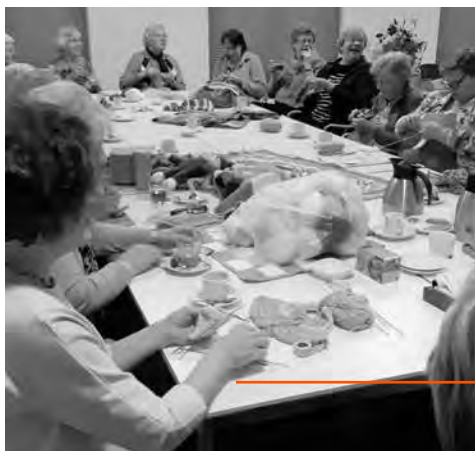
De Breigroep Lonneker in actie

De breigroep kiest voor de veertigdagen tijd bijzondere projecten uit. Dit jaar is ervoor