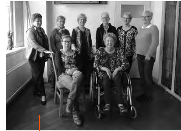
De PCI werkgroep Gaanderen

Op eenzelfde manier zetten de werkgroepleden zich bij veel activiteiten in waar helpende handen worden gevraagd. Te denken valt aan de Mariapassie, de Levende Kerststal, het Goede Vrijdagconcert en het bedankfeest voor alle vrijwilligers. De werkgroep PCI zorgt dan bijvoorbeeld voor drinken en een broodje. Ook bij het verzorgen van inspiratievieringen bieden