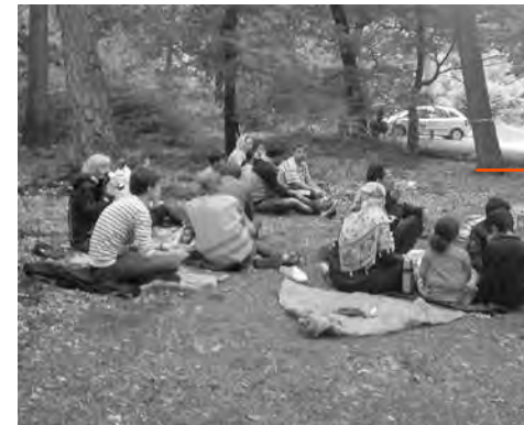
Rustpauze op de picknickplaats