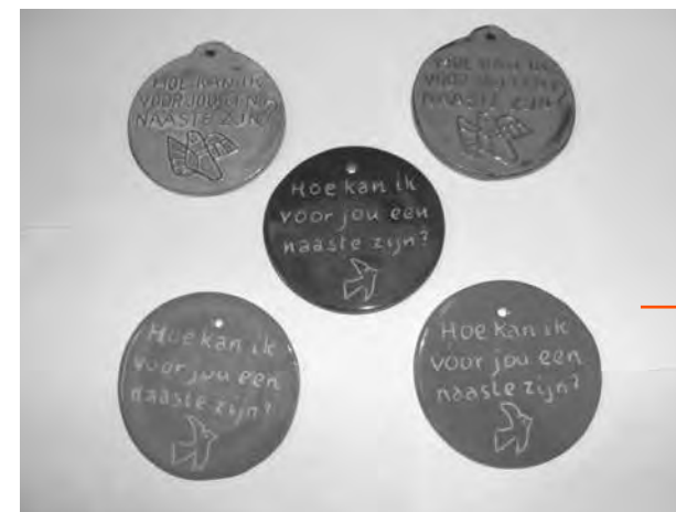
Vijf plaquettes van de Ariëns

viering in juni werd in de traditie geplaatst van de oogstdankdag. Ook dit jaar, 2019, komt de oogstdankdag in beeld bij de oogstgave in Raalte van boeren