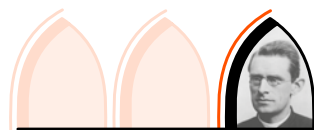
Stichting Het Ariëns-Comité