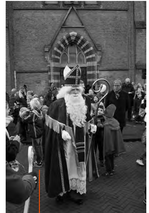
Bij de jaarlijkse intocht in Borne komt de Sint dichtbij de kerk

De actie is goed te doen voor mensen in andere plaatsen. Er is samenwerking met andere kerkelijke diaconale organisaties, er zijn adressen, er is inzet en menskracht om de cadeaubonnen zelf af te geven en met mensen in contact te komen. En heel belangrijk: er is een visie van waaruit men iets wil doen. Armoede