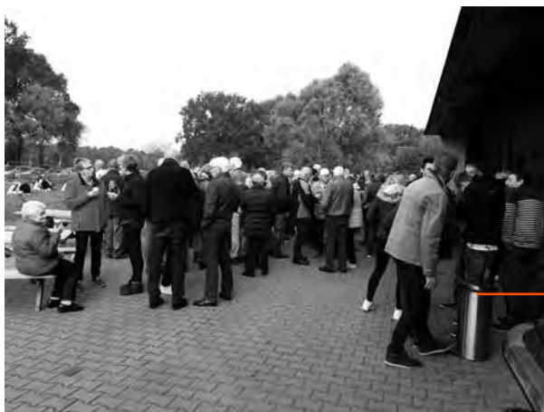
Natuurlijk valt er veel na te praten na de viering

Na de viering is er een rondleiding over het bedrijf en kan er met de betreffende boer en boerin gesproken worden over hun bedrijf, over hun wijze van werken en over de zorgen en vragen die er leven. Burgers ervaren daar, dat de problematieken waar de boeren mee te kampen hebben, complexer zijn dan wat de media laten zien.