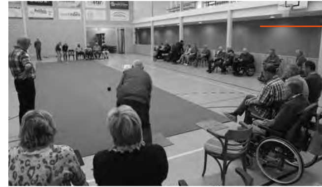
De Kearls aan het kegelen