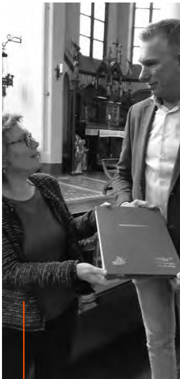
In gebruikname van het herinneringsboek

zorgvragen zijn zeer divers, en die diversiteit is er ook in het team van Stichting NAbij van 35 personen. Daardoor kunnen ze bij elke situatie aansluiten. Bij spoedvragen is 24-uurs zorg mogelijk.