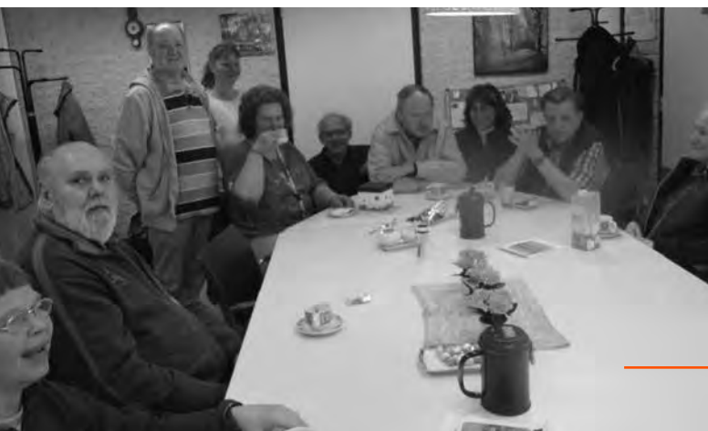
De grote tafel in de huiskamer is altijd goed gevuld

en binnenkort ook het gezondheidscentrum. Het inloophuis is 's ochtends van dinsdag tot en met vrijdag open, op dinsdag is er ook voedselbank en op zaterdagochtend inloop-plus-ruilwinkel. Op