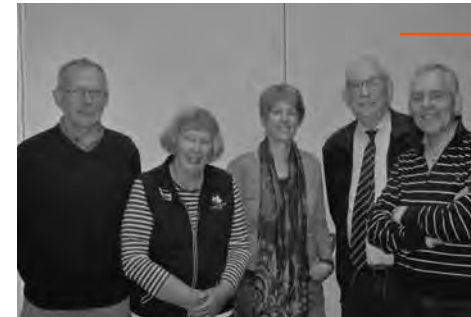
De werkgroep Diaconie en Liturgie

De groep cursisten heeft voorlopig de taak van de werkgroep diaconale vieringen op zich genomen en startte met overleg met de voorgangers. Zij stemden in met de voorstellen. Van