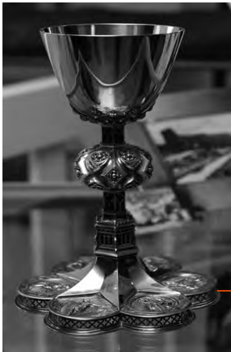
De gouden kelk van Ariëns, die hij verkocht ten behoeve van de arbeiders in de weverij 'De Eendracht'

economie, zegt de kerk, moet niet het aandeelhoudersbelang voorop staan maar de continuïteit van de onderneming en de bijdrage ervan aan het algemeen welzijn. En sinds de encycliek 'Laudato Si' ziet de kerk het grote belang van een duurzame ontwikkeling. Armoedebestrijding en het goed omgaan met de klimaatverandering zijn twee speerpunten die nauw met elkaar samenhangen. Overheid en particulier initiatief dienen daarbij nauw samen te werken. Nu valt tegen te werpen dat we in diaconale projecten bezig zijn met concrete mensen. Wat maakt het voor die projecten uit dat de kerk een sociale leer heeft? Daar wordt onze inzet toch niet anders door? Welnu: deze blikvernauwing treedt op als er weinig traditie is om na te denken over de maatschappelijke context. Als theologische werkgroep van de jury durven wij de volgende tegendraadse stelling aan: stuk voor stuk passen de projecten binnen een bredere maatschappelijke beweging die aan de basis, in het dagelijks leven met elkaar een