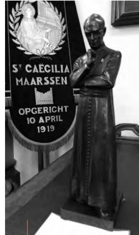
Ariënsbeeld gemaakt door Bon Ingen-Housz in 1937 en vaandel van St. Caecilia koor in Maarssen