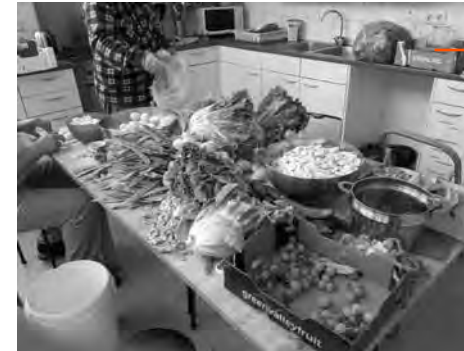
De keuken is het hart van alle kookactiviteit

Eenmaal per maand is er op dinsdag een maaltijd voor wijkbewoners. Dan komen er tussen de 20 en 25 mensen. Er is maar een kleine overlap met de maandag. Het buurthuis nodigt mee uit. Het kinderwerk van een welzijns-koepel organiseert een kinderkookclub. Dit is niet het hele verhaal over voedsel. Want het Inloophuis is ook een doorgeefluik voor grote hoeveelheden voedsel, die mensen met een kleine beurs thuis bereiden. Dat komt omdat er diverse aanvoerlijnen zijn. Marktkooplieden en anderen geven wat niet verkocht is aan de stichting EVS Ecovrede, die het weer doorgeeft. Hetzelfde doen de