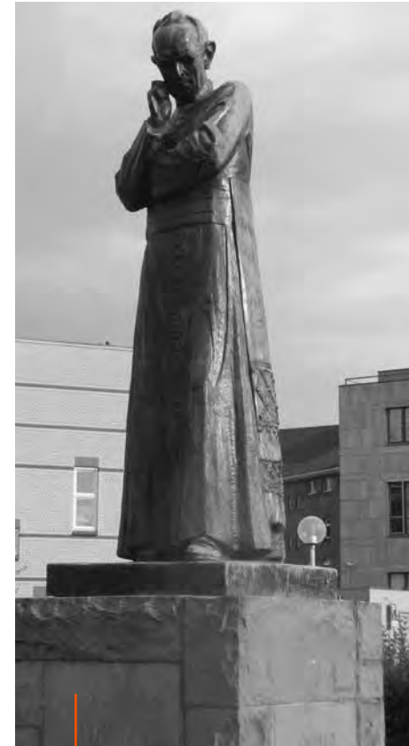
Het standbeeld van Ariëns dat in 1934 is onthuld in Enschede