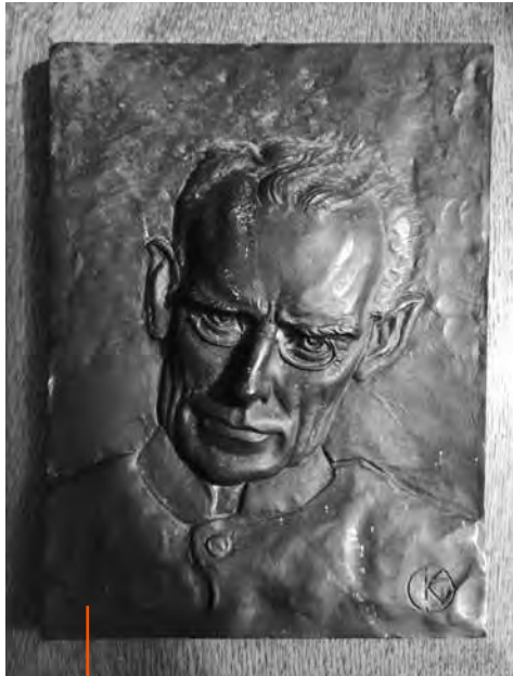
Koperreliëf van Alphons Ariëns